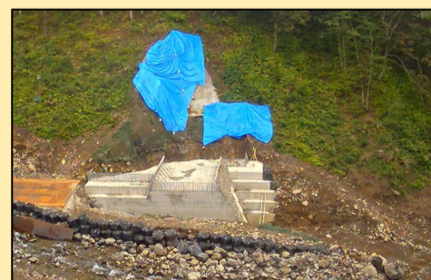
本体コンクリート打設