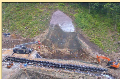
本体コンクリート打設開始 10月下旬