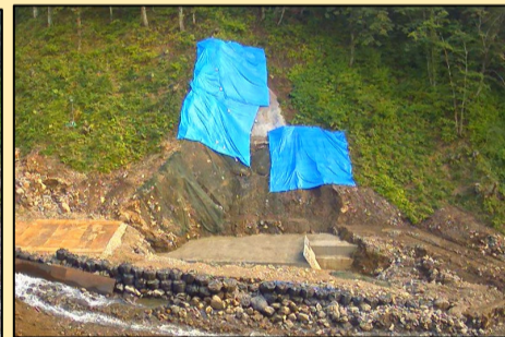
本体コンクリート打設 11月下旬