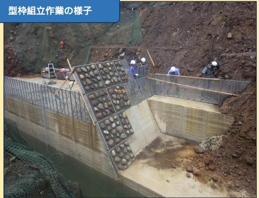
型枠組立作業の様子