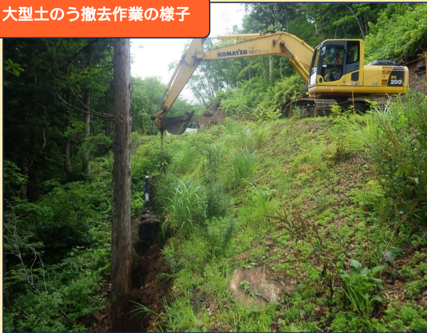
大型土のう撤去作業の様子