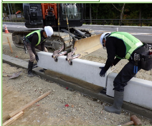
縁石据付け工事の様子